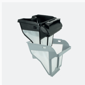
2 Filterkörbe für doppelte Filterung: Äußerer Filterkorb 60 µm Innerer Filterkorb 150 µm