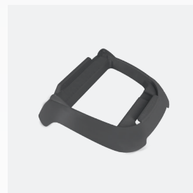
Sockel für die Steuerbox